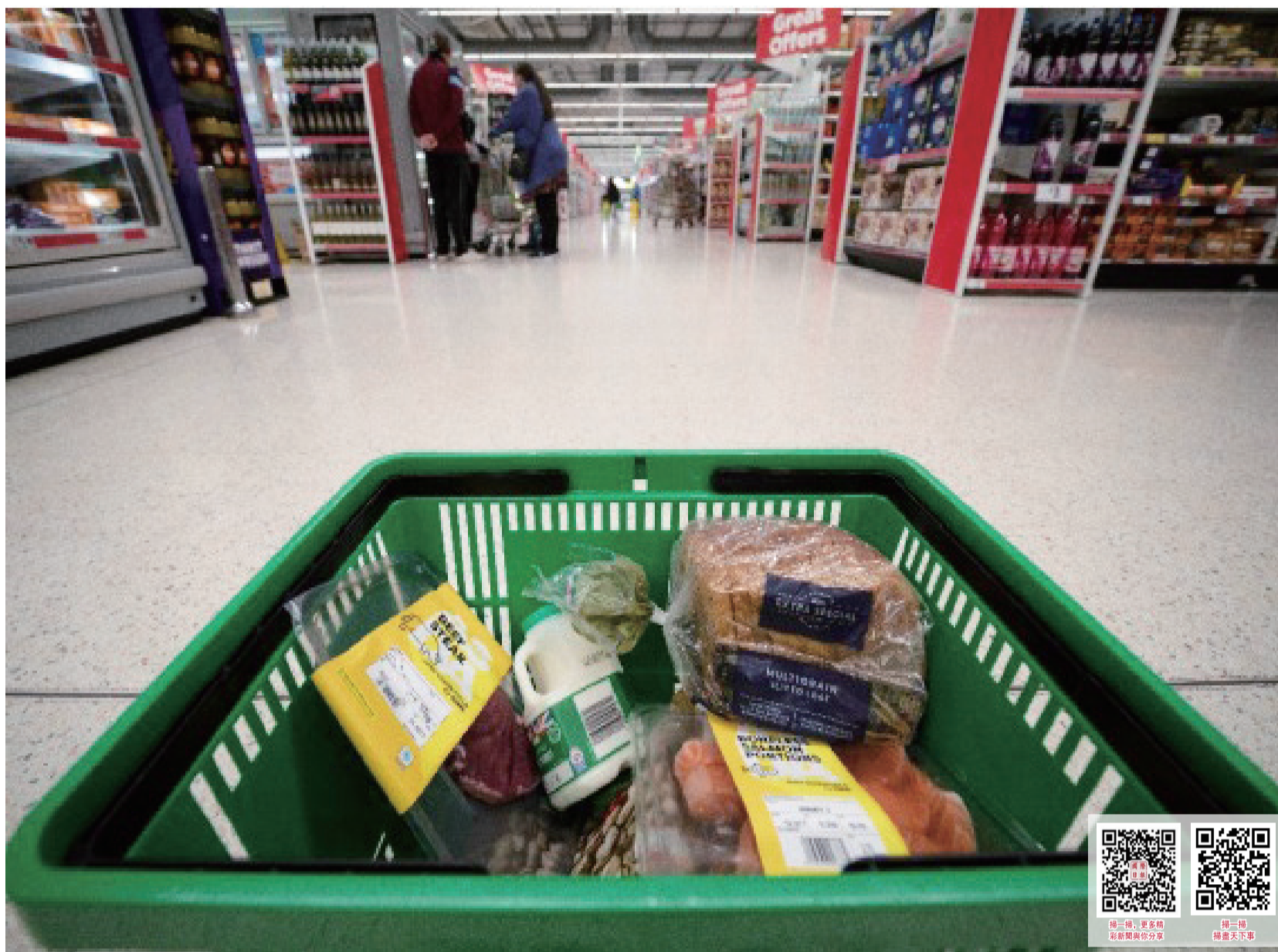
習慣購買的食品種類更為便宜的食品。 (卜曉明)

英國消費者協會20日發佈的調查結果顯示，隨著生活成本不斷上漲，85%的英國人正在減少食品方面的花銷，以節省開支。這項調查顯示，55%的受訪對象說他們會設法購買促銷食品；50%的人「消費降級」，選購比過去